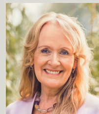
Mechtild Schulze Hessing Bürgermeisterkandidatin